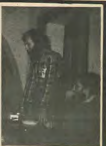
άνθρωπους οι οποίοι συνεργάστηκαν με το Φράνκο και παρουσιάζονται σήμερα σαν οι μετανοήσαντες ή δημοκράτες.

Σήμερα όσο ποτέ άλλοτε το Ισπανικό κίνημα χρειάζεται διεθνή συμπαράσταση.